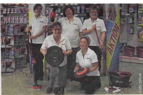
Das Team von Vileda. Das deutschlandweit einzige Outlet befindet sich in der Reichenberger Straße 39 in Augsburg, in der Nähe von Boesner und Real.